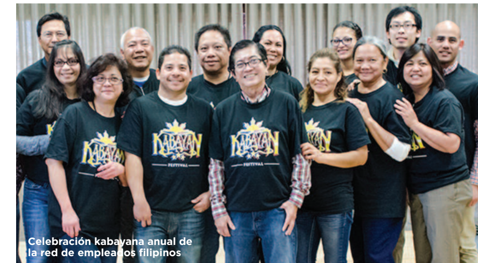
Celebración kabayana anual de la red de empleados filipinos