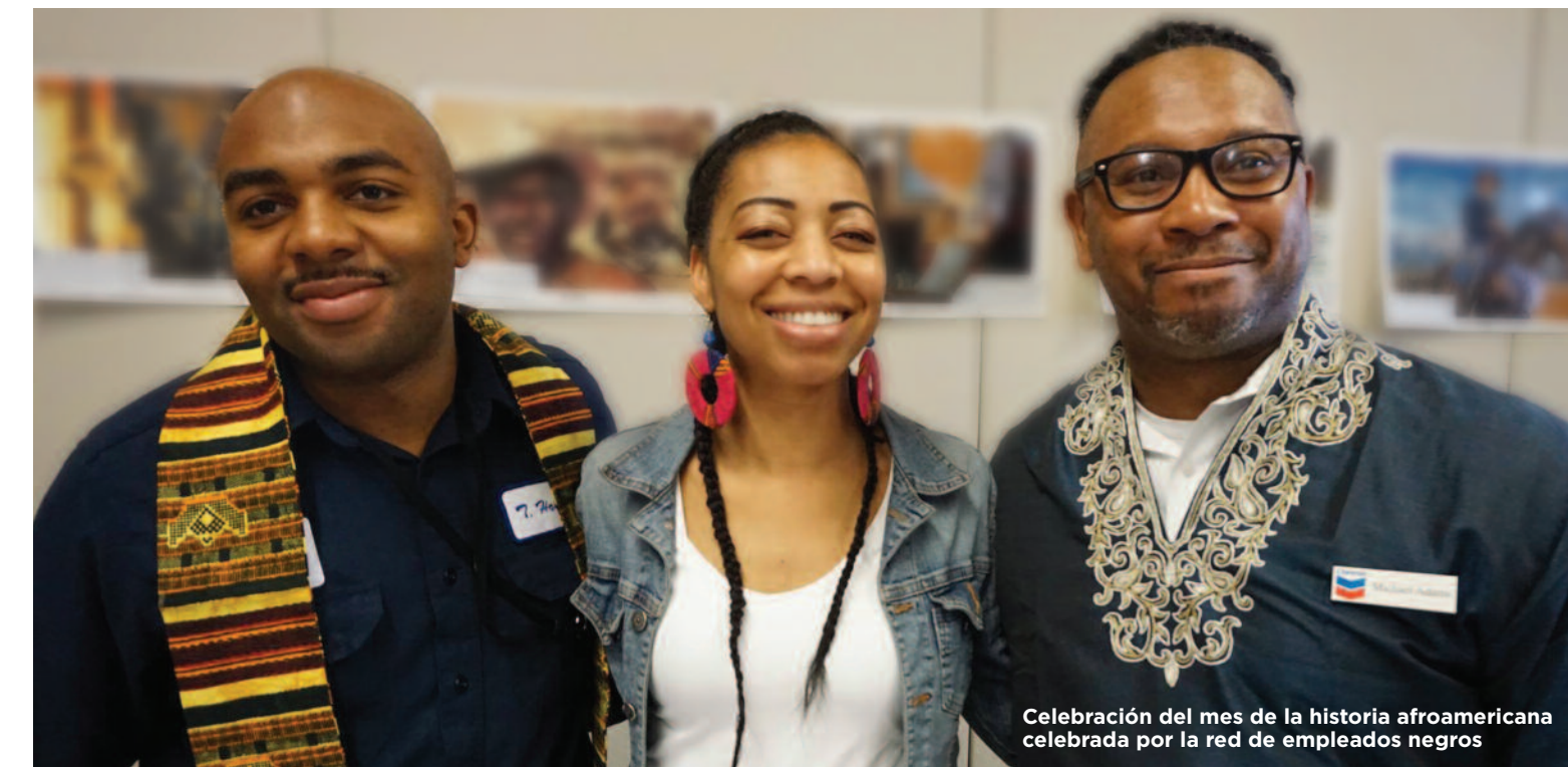
Celebración del mes de la historia afroamericana celebrada por la red de empleados negros

en becas a estudiantes de secundaria cada año? Visita www.chevronrichmond.com para ver más información.