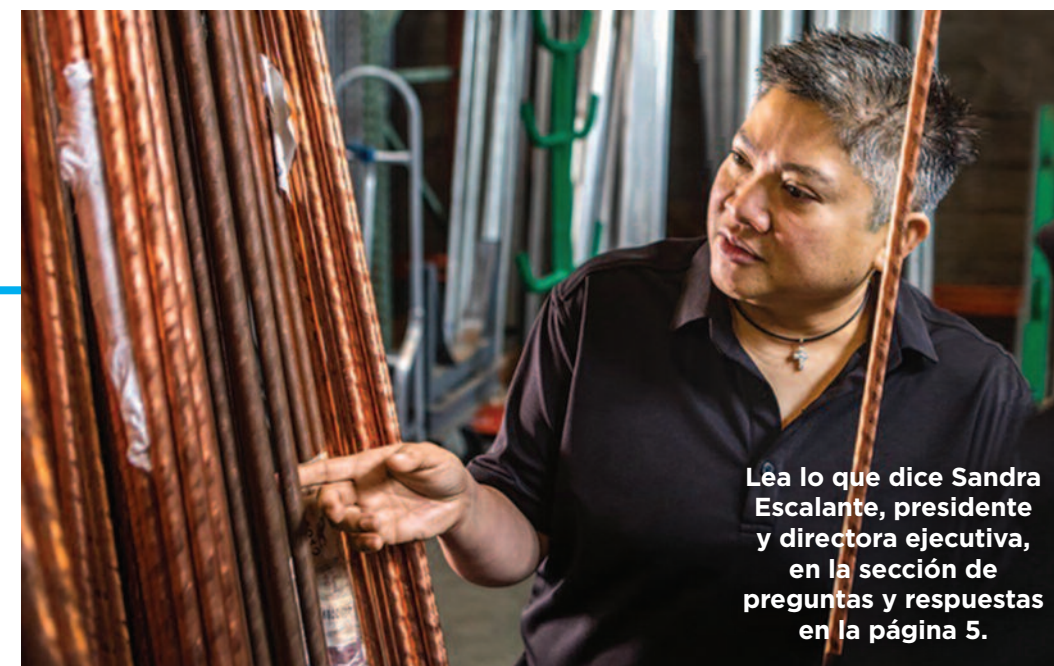
Léa lo que dice Sandra Escalante, presidente y directora ejecutiva, en la sección de preguntas y respuestas en la página 5.

mentores para el éxito Laner Electric Supply se convirtió en una pequeña empresa certificada y ahora es reconocido como uno de los principales negocios de 50 negocios de propiedad de LGBT en el Norte de California.